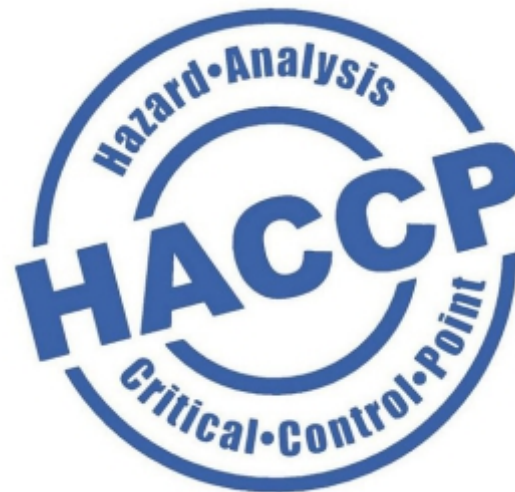
HACCP (Hazard Analyst Critical Control Point)