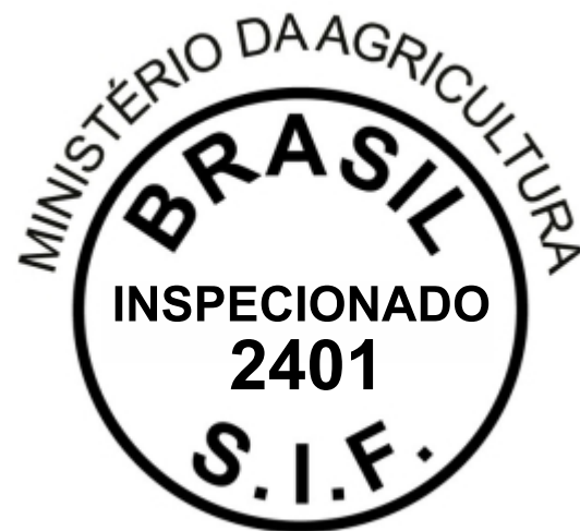
Serviço de Inspeção Federal sob o nº 2401